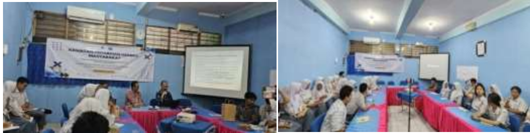
Gambar 1. Dokumentasi Photo Kegiatan Pelatihan

Tujuan: Peserta memiliki pemahaman dan menguasai kemampuan dalam menggunakan Web EFAKTUR