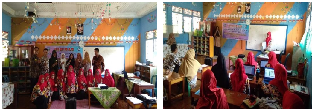
Gambar 3. Seminar hasil PTK

Pada tahapan akhir, setelah selesai pembuatan laporan, hasil penelitian diseminarkan oleh masing-masing guru dengan diikuti oleh pihak dinas pendidikan Kabupaten Dharmasraya, pembimbing, dan penguji. Hasil akhirnya dapat dijadikan sebagai salah satu persyaratan untuk pengajuan kenaikan pangkat. Gambar 3 merupakan kegiatan seminar yang dilakukan oleh guru TK yang telah melakukan pelatihan dan pembimbingan PTK dengan dihadiri oleh pihak dinas Kabupaten Dharmasraya.