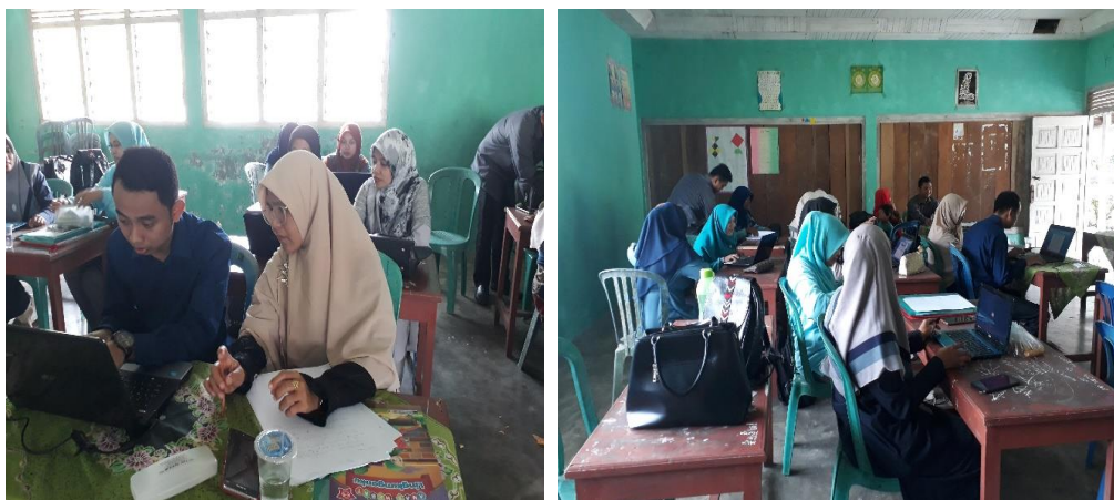
Gambar 2. Kegiatan bimbingan pelaksanaan PTK dan pembuatan laporan

Setelah dijelaskan tentang PTK, masing-masing guru diminta untuk melaksanakan PTK dengan terlebih dahulu melakukan bimbingan kepada masing-masing pembimbing yang telah dibagi. Awalnya guru diminta untuk membuat proposal penelitian dan guru diminta untuk melakukan penelitian setelah proposal tersebut disetujui oleh masing-masing pembimbing. Pengabdian ini dilakukan 1 kali dalam seminggu. Gambar 1 merupakan kegiatan bimbingan yang dilakukan pengabdian kepada guru.